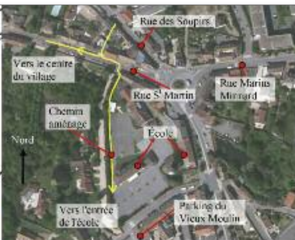
Fig. 2 - Accès de la rue des Soupirs vers le centre du village et l'école Émile Serre, vue réalisée à partir de "Google Earth".