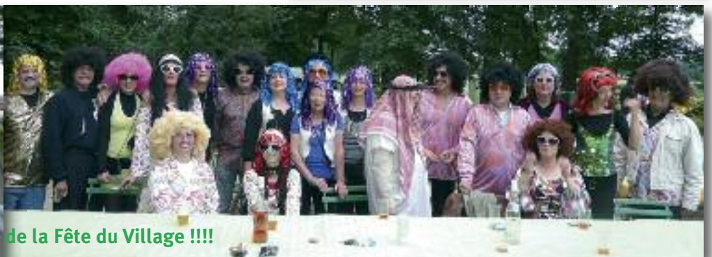
Les GO de la Fête du Village !!!!