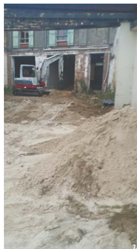
7. Vue du numéro 17 de la rue saint Martin. 8. «Liaison douce» entre la rue des Soupirs et la rue Saint Martin, d'après [1].