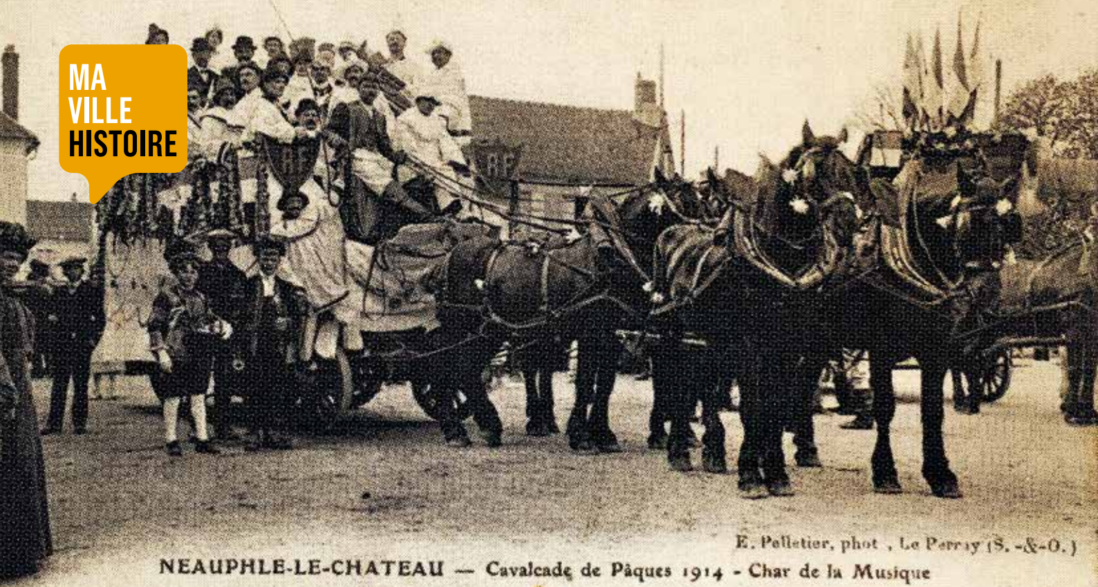
NEAUPHLE-LE-CHATEAU — Cavalcade de Pâques 1914 - Char de la Musique