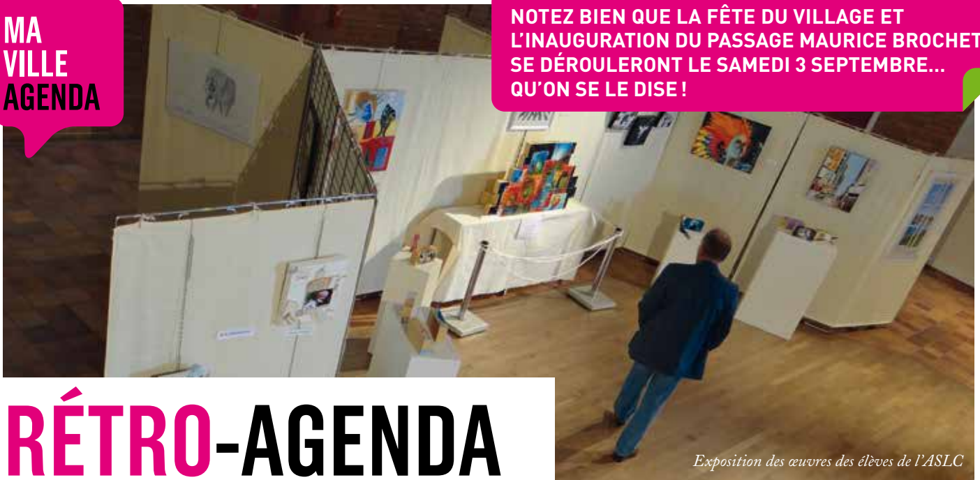
Exposition des œuvres des élèves de l'ASLC

NOTEZ BIEN QUE LA FÊTE DU VILLAGE ET L'INAUGURATION DU PASSAGE MAURICE BROCHET SE DÉROULERONT LE SAMEDI 3 SEPTEMBRE... QU'ON SE LE DISE !