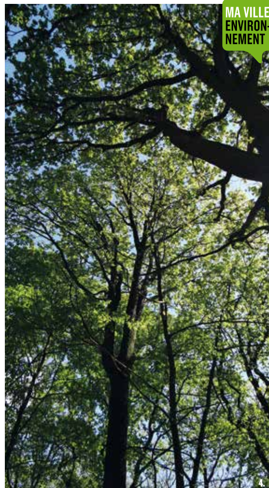
1. Mésange boréale, source Wikipédia, © Francis C. Franklin / CC-BY-SA-3.0, 2014. 2. Bouquet de hêtres. Le réchauffement climatique induit déjà un dépérissement visible [8]. 3. Les bouleaux auront disparu des Yvelines en 2080 pour s'implanter favorablement dans les pays du nord comme la Suède et la Norvège [8]. 4. Les chênes disparaîtront des forêts franciliennes pour s'implanter au mieux au nord et nord-est de l'Europe [8].

Les chênes, les hêtres et les bouleaux disparaîtront ainsi progressivement pour laisser place aux arbres mieux adaptés aux longues périodes de sécheresse comme le chêne vert ou les pins méditerranéens.