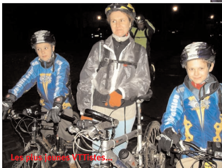
Les plus jeunes VTTistes...

Neauphle s'est réveillé le samedi 9 décembre sous un grand soleil mais encore beaucoup de vent. Une tonnelle attendait les Neauphléens place du marché pour la vente de vin chaud, brioches, peluches Téléthon et objets réalisés par les enfants de la garderie .... avec toujours les tapis de course (1 km parcouru = 1 petit déjeuner offert).