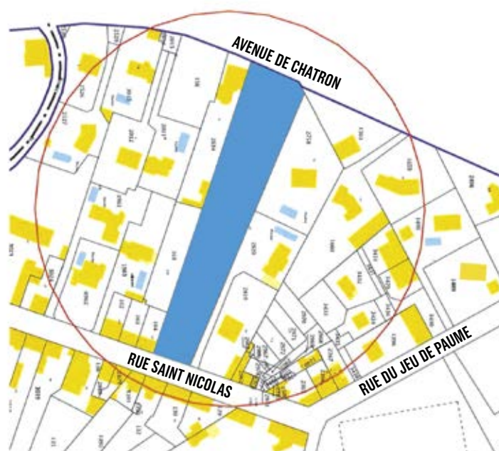
2. Terrain Orange 3. Terrain Bourlot