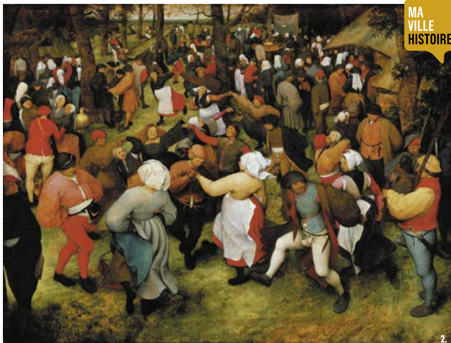
1. Jan Steen (1626 -1679): Autoportrait en joueur de luth 2 & 3. Pieter Bruegel (1525-1569): Danse des paysans